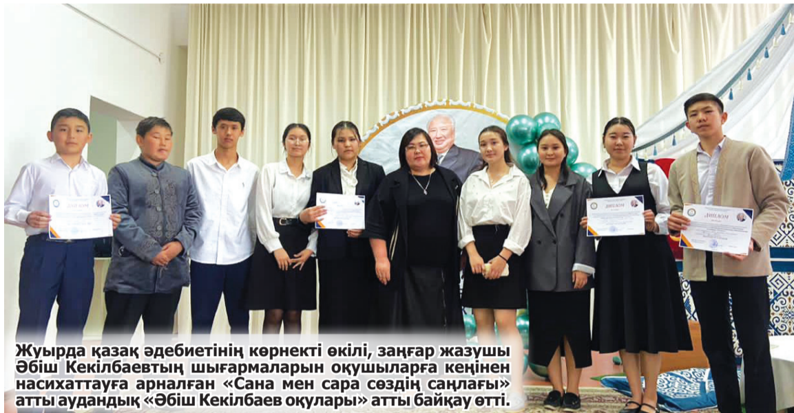
Жуырда қазақ әдебиетінің көрнекті өкілі, заңғар жазушы Әбіш Кекілбаевтың шығармаларын оқушыларға кеңінен насихаттауға арналған «Сана мен сара сөздің саңлағы» атты аудандық «Әбіш Кекілбаев оқулары» атты байқау өтті.

Оқушылардың жазушы шығармаларына деген қызығушылығын арттыру, олардың шығармашылық қабілеттерін дамыту, эстетикалық талғамы мен сөз мәдениетін қалыптастыру, сондай-ақ жас ұрпақты ұлттық рух пен рухани мұраға деген сүйіспеншілікке тәрбиелеу көзделген әдеби кештің шымдылығы әсем әнмен түрілді. Бірнеше бағыт бойынша ұйымдастырылған шарада қатысушылар жазушының прозасы мен поэзиясынан үзінділерді мәнерлеп жатқа оқып, шығармалары негізінде сахналық қойылымдар қойды. Зерттеу