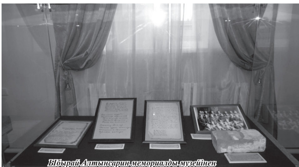
Ыбырай Алтынсарин мемориалды музейінен

Бұл жылы Әулиеатада алғашқы екі жылдық орыс-түзем мектебі ашылған еді. Ол жайында Ташкенттегі Әлішер Науаи атындағы мемлекеттік кітапхана қорында сақтаулы тұрған «Түркістан ведомостарының» 1878 жылғы 13 маусымдағы №23 жазбасында жазылған. Онда былай делінген: «Оқу ведомствосы бойынша бұйрық. 1878 жыл, 24 мамыр, №64. Сырдария облысының әскери губернаторының өтініші мен училищелердің бас инспекторының ұсынысына сүйене отырып, 1878 жылғы 10 маусымнан бастап Әулие-Ата қаласында екі сыныптық қалалық училище ашуға рұқсат етемін. Түпнұсқаға қол